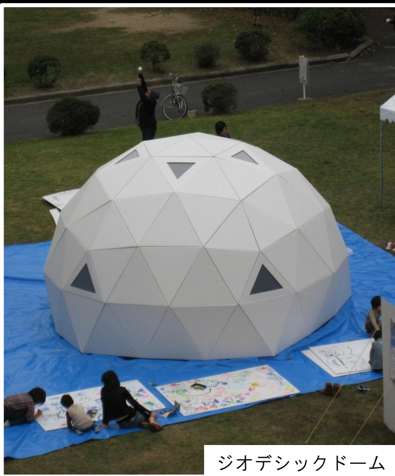
ジオデシックドーム